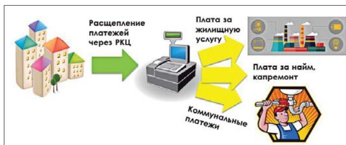
Рис. 3. Схема работы РКЦ

Концепция РКЦ как единого центра информатизации достаточно привлекательна для многих участников отрасли. В течение 2015 года к расчетам через РКЦ присоединились администрация Норильска в части организации расчетов по договорам социального и коммерческого найма, а также четыре УК. Таким образом, в настоящее время охвачено 90% рынка ЖКУ города. Результат очевиден: процент оплаты за коммунальные услуги управляющими организациями в адрес РСО за 2016 год достиг 99%, тогда как в 2013-м он составлял 84%.