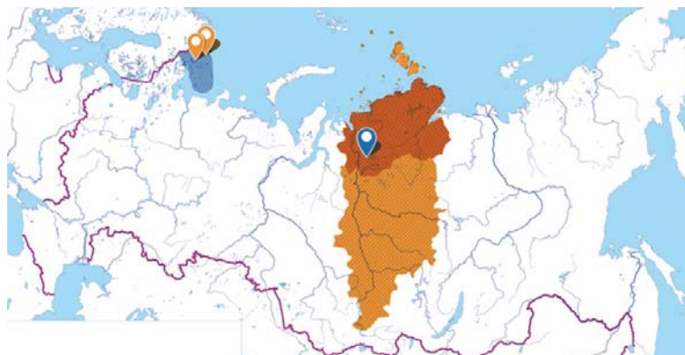
Рис. 1. Географическое положение Норильска на карте России

В основном проблема неплатежей в российских муниципалитетах существует при неполном получении УК денежных средств с населения. В этом случае УК, не имея иных источников дохода, не имеет и возможности оплатить РСО потребленные ресурсы. Возникает задолженность, растущая, как снежный ком. В Норильске сложилась ситуация, когда денежные средства поступали на счета некоторых УК с населения в оплату конкретных коммунальных ресурсов, но долгое время не перечислялись в пользу РСО. В данном случае прослеживались умышленные неправомерные действия УК по удержанию