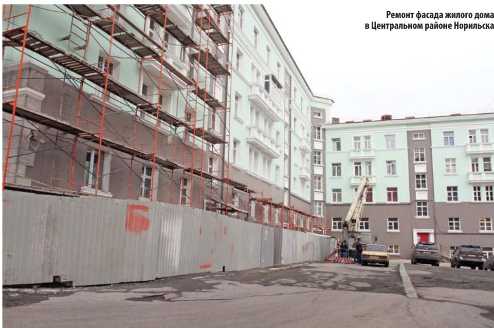
Ремонт фасада жилого дома в Центральном районе Норильска

В целом можно сказать, что все действия по реформированию отрасли ЖКХ в Норильске направлены на то, чтобы сделать более комфортной жизнедеятельность и защитить законные права и интересы жителей Крайнего Севера, живущих в тяжелых природно-климатических условиях. На примере Норильска можно отметить, что такой опыт эффективного взаимодействия органов местного самоуправления, УК, РСО и общественных организаций, а также других представителей гражданского общества может быть использован во многих российских городах. Это подтвердили и эксперты форума ЖКХ, предложившие применить алгоритм создания РКЦ в других моногородах Арктической зоны России.