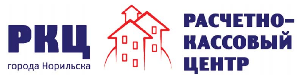
Рис. 2. Фирменный стиль РКЦ Норильска

сирование в счет оплаты будущих услуг. Специалистами РКЦ был рассчитан тариф, который покрывал также единовременные расходы на запуск предприятия. Таким образом, муниципалитет не вложил ни рубля бюджетных средств.