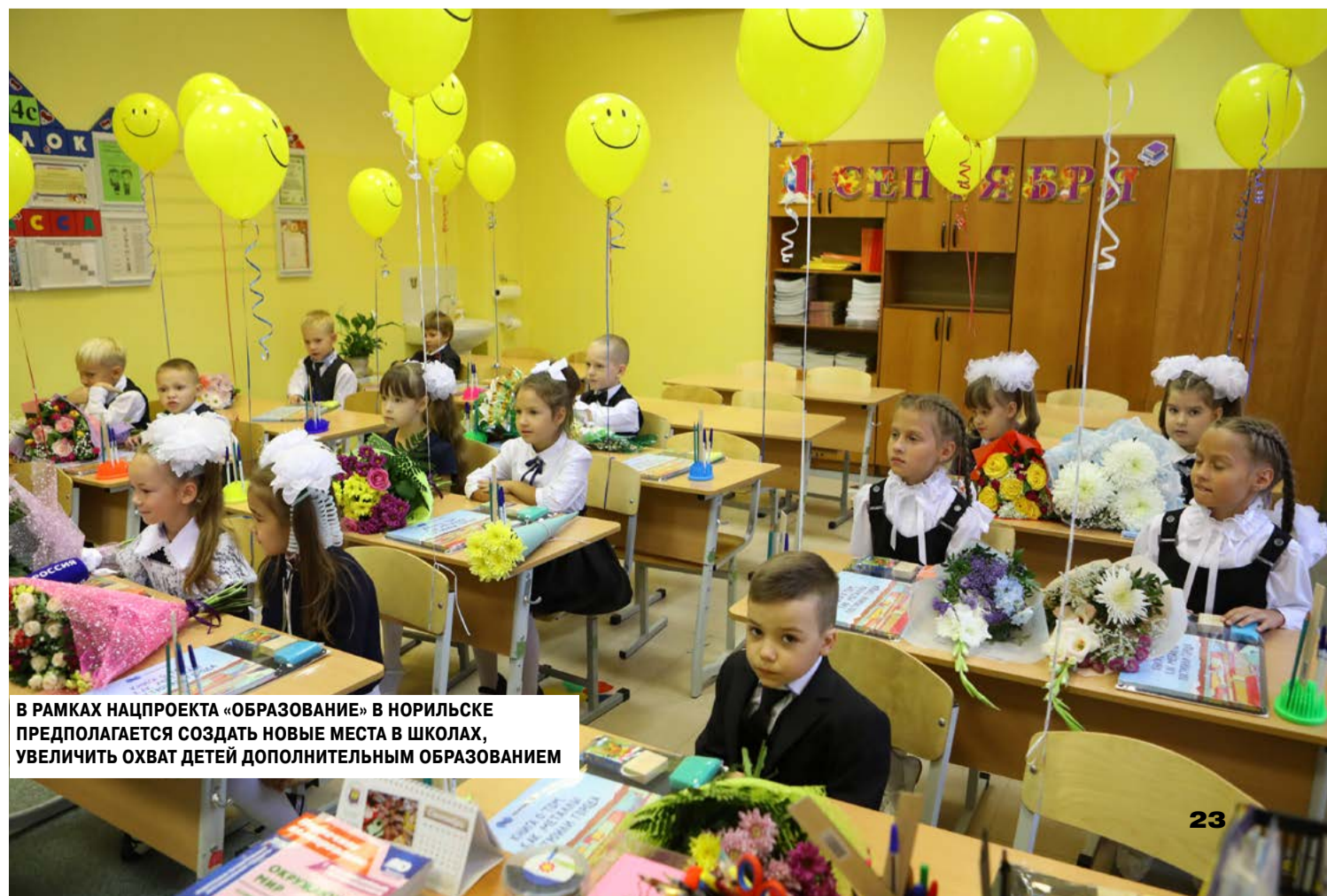
В РАМКАХ НАЦПРОЕКТА «ОБРАЗОВАНИЕ» В НОРИЛЬСКЕ ПРЕДПОЛАГАЕТСЯ СОЗДАТЬ НОВЫЕ МЕСТА В ШКОЛАХ, УВЕЛИЧИТЬ ОХВАТ ДЕТЕЙ ДОПОЛНИТЕЛЬНЫМ ОБРАЗОВАНИЕМ

беседовала ЕЛЕНА СЕРОВА